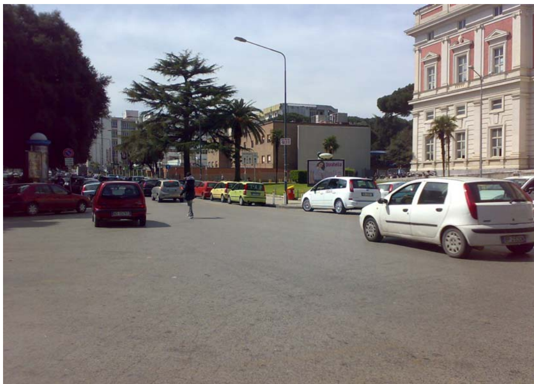
Via Cardarelli, tratto prospiciente l'ospedale Cardarelli