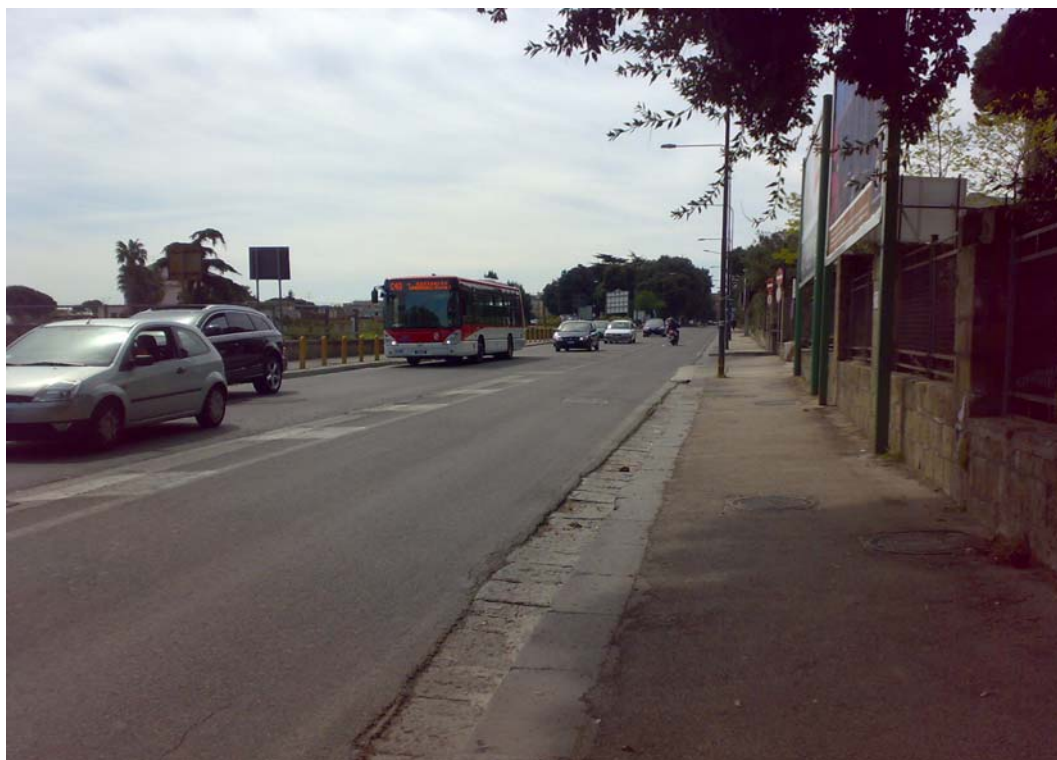
Via Cardarelli, tratto verso viale Colli Aminei