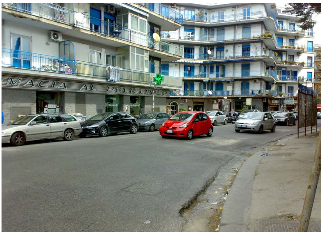
Via Pietravalle, tratto verso via Pansini