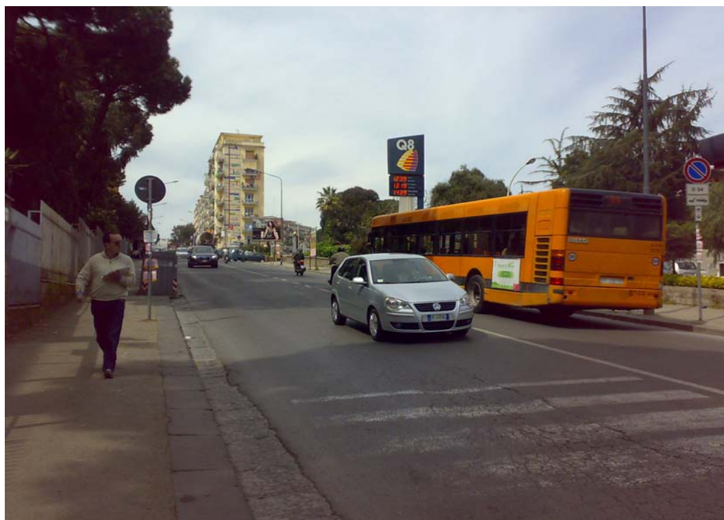
Via Pietravalle, tratto in prossimità del Policlinico