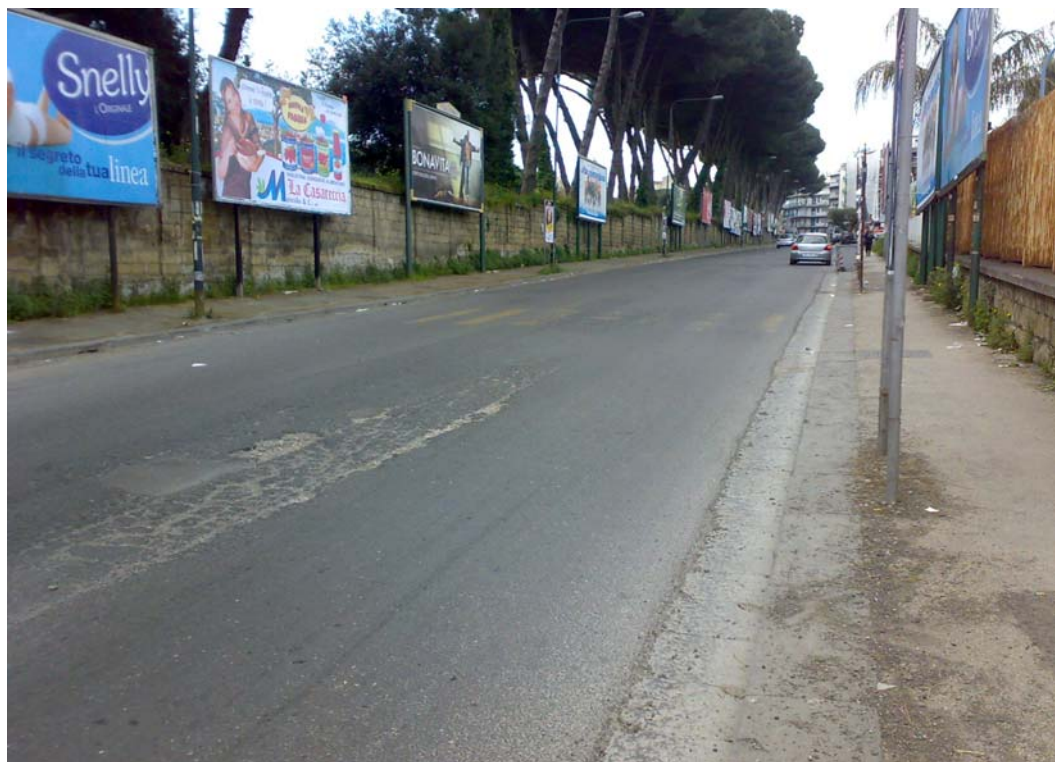
Via Pietravalle, tratto verso incrocio con via Cardarelli